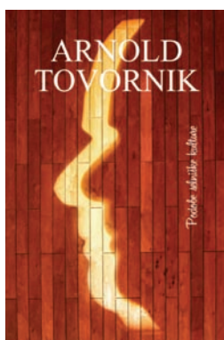
■ Publikacija o kulturnem razvoju v Selnici ob Dravi in igralcu, tamkajšnjem rojaku, Arnoldu Tovorniku (izšla 2020)

Povezovanje z lokalno skupnostjo je temelj domoznanske dejavnosti. Razvejana mreža 19 knjižničnih enot in potujoče knjižnice z bibliobusom, ki pokriva območje 12 občin (Maribor, Duplek, Hoče - Slivnica, Kungota, Lovrenc na Pohorju, Miklavž na Dravskem polju, Pesnica, Rače - Fram, Ruše, Selnica ob Dravi, Starše in Šentilj), Mariborski knjižnici omogoča, da z lokalnim okoljem lažje navezuje stike in se z njim v večji meri povezuje. Sodelovanje z lokalno skupnostjo prinaša pozitivne učinke, vpliva na večjo prepoznavnost tako lokalnega okolja kot knjižnice, prav tako pa ima obojestranske in splošne koristi, ki se kažejo v oblikovanju in rasti domoznanske knjižnične zbirke, digitalizaciji, predstavljanju vsebin na portalu digitalizirane kulturne dediščine Kamra, biografskih geslih znamenitih posameznikov v spletnem biografskem leksikonu Obrazi slovenskih pokrajin, promociji lokalne zgodovine in kulture z različnimi prireditvami ter razstavami in podobno.