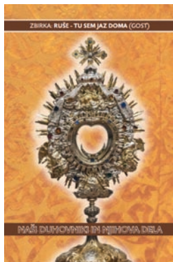
■ Naslovnica zbornika s 6. Glazerjevega posveta Naši duhovniki in njihova dela (izšel 2020)