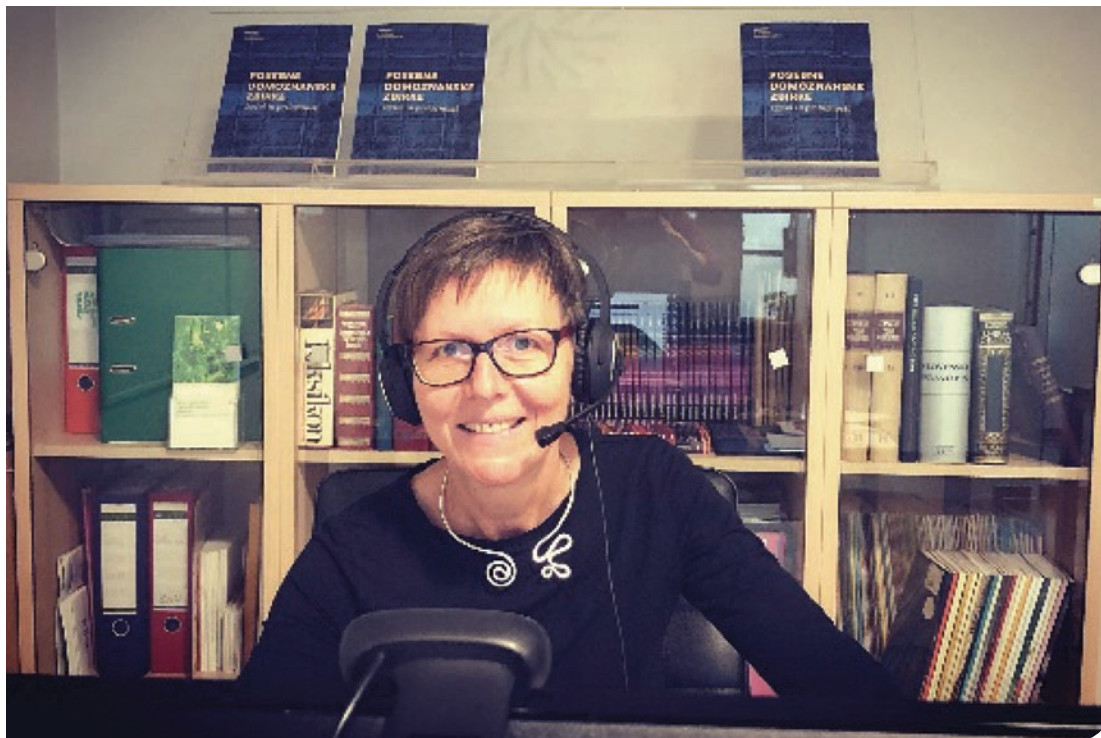
■ Moderatorka v elementu